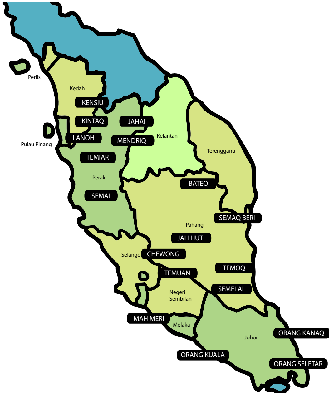
Rajah 1: Taburan Kedudukan Suku Kaum Orang Asli

Nota: Peta ini adalah anggaran kedudukan taburan suku kaum Orang Asli dan peta ini tidak menggambarkan taburan tepat sempadan tradisional suku kaum Orang Asli